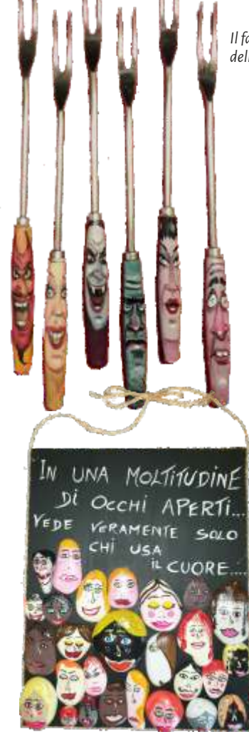
Il fantasma dell'opera