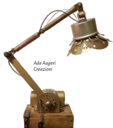
Ada Augeri Creazioni