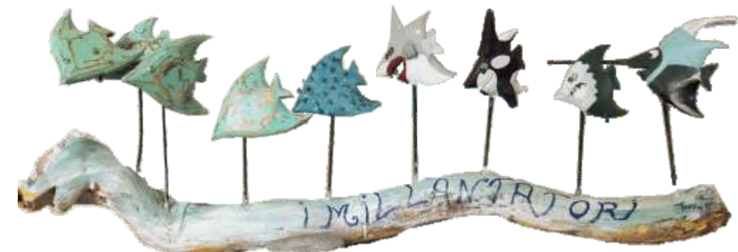
Il tuo stile